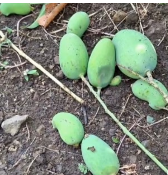
होती. दरम्यान, १८ मे रोजी राज्य शासनाने अवकाळी पावसामुळे नुकसान झालेल्या शेतकऱ्यांना आर्थिक

या नैसर्गिक आपत्तीमुळे मका, गहू, हरभरा, ज्वारी, कांदा, टरबूज तसेच आंबा यांसारख्या पिकांचे मोठे नुकसान झाले. शासनाच्या आदेशानुसार संबंधित यंत्रणांनी पंचनामे केले असून, विविध लोकप्रतिनिधींनीही नुकसानग्रस्त भागांची पाहणी केली होती. त्यामुळे शासनाकडून मदत मिळेल, अशी अपेक्षा शेतकऱ्यांना