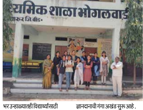
भर उन्हाळ्यातही विद्यार्थ्यांसाठी ज्ञानदानाची गंगा अखंड सुरु आहे.