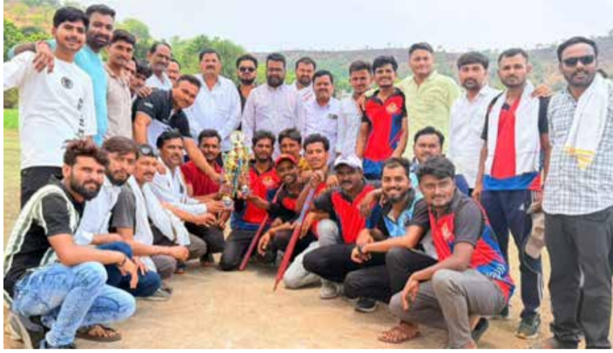
आपले नाव कोरले.

माजलगाव / प्रतिनिधी : भोगलवाडी जिल्हा परिषद गटांतर्गत आयोजित करण्यात आलेल्या लोकनेते स्व. गोपीनाथरावजी मुंडे साहेब चषक क्रिकेट स्पर्धा उत्साहात पार पडल्या. या स्पर्धेतील अंतिम सामना पहाडी पारगाव क्रिकेट संघ आणि भोगलवाडी क्रिकेट संघ यांच्यात रंगला. अत्यंत अटीतटीच्या आणि रोमांचक झालेल्या या सामन्यात पहाडी पारगाव संघाने शानदार कामगिरी करत विजेतेपद पटकावले.