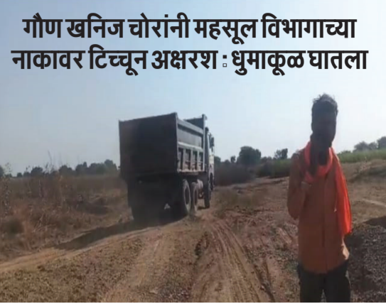
गौण खनिज चोरांनी महसूल विभागाच्या नाकावर टिचून अक्षरशः धुमाकूळ घालला

ईतर भागातून कधी रात्री तर कधी दिवसादरवळ्या जेसीबी, पोकलेन यंत्राच्या सहाय्याने बेकायदेशीर उत्खनन करून दर रोज लाखो रुपयांच्या गौण खनिजाची विक्री करत आहेत. या संबंधीचे तसे व्हिडिओ सोशल मीडियावरून तुफान व्हायरल होत आहे. परन्तु या सर्व प्रकाराकडे संबंधित सज्जाचे जबाबदार तलाठी, मंडल अधिकारी तर सोडाच परंतु पैठण तहसीलच्या तालुकादांडाधिकारीमंडळ, यावर