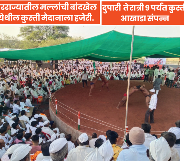
आष्टी तालुक्यातील बांदखेल येथील ऐतिहासिक मैदान पहाण्यासाठी कुस्ती प्रेमींची तुफान गर्दी.