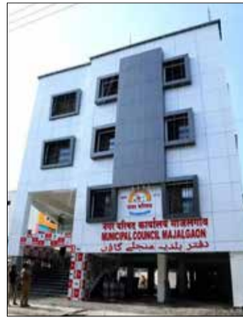
रुपयांची कामे हाती घेण्यात आली आहेत. त्याचबरोबर १५ कोटी रुपयांच्या नाल्या व सिमेंट रस्त्यांची कामेही सुरू आहेत.

सिंदफणा नदीपुल ते सिद्धेश्वर मंदिर परिसरात घाट, रस्ता व सुशोभीकरणासाठी १८ कोटी रुपयांची कामे सुरू आहेत. तसेच शहरातील इंदिरानगर रोड, शासकीय गोदाम ते मंजरथ रोडसह विविध डीपी रस्त्यांसाठी सुमारे ४० कोटी