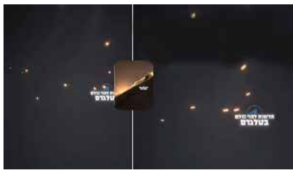
देखील समाविष्ट असू शकतात. सूत्रांनुसार, इराणची सुमारे 50

पाच आठवड्यांत अमेरिका आणि इस्त्रायलने वारंवार लष्करी हल्ले करूनही, इराणचे जवळपास निम्मं क्षेपणास्त्र प्रक्षेपक शाबूत आहेत. इराणकडे हजारां 'एकतर्फी हल्ला करणारे झोन' देखील आहेत. या माहितीशी परिचित असलेल्या तीन सूत्रांनी 'द टाइम्स ऑफ इस्त्रायल' ला सांगितले की, या आकड्यात हल्ल्यांनंतर जमिनीखाली गाडलेले आणि सध्या वापरात नसलेले, परंतु पूर्णपणे नष्ट न झालेले प्रक्षेपक