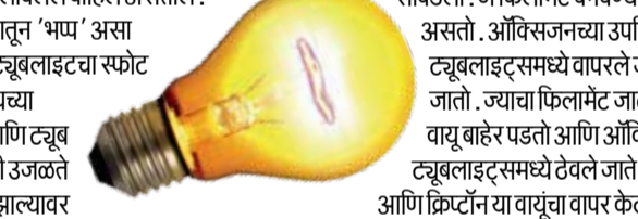
ट्यूबलाइटमध्ये सापडला. जे फिलामेंट बनवण्यासाठी सर्वोत्तम आहे. बल्ब आणि ट्यूबलाइटचा फिलामेंट टंगस्टन धातूपासून बनलेला असतो. ऑक्सिजनच्या उपस्थितीत ते वीज पार करून जाऊले जाऊ शकत नाही. त्यामुळे जेव्हा ते बल्ब आणि ट्यूबलाइटमध्ये वापरले जातात तेव्हा त्यातून ऑक्सिजन काढून टाकला जातो. त्यापैकी दुसरा गॅस वापरला जातो. ज्याचा फिलामेंट जाळण्यात मोठा हाभार लागतो. जेव्हा बल्ब किंवा ट्यूबलाइटचा स्फोट होतो, तेव्हा वायू बाहेर पडतो आणि ऑक्सिजनमध्ये मिसळतो, तेव्हा फुस्फुसणारा आवाज येतो. जेव्हा फिलामेंट बल्ब आणि ट्यूबलाइटमध्ये ठेवले जाते तेव्हा ऑक्सिजन पूर्णपणे काढून टाकला जातो. त्यापैकी हीलियम, निऑन, नायट्रोजन आणि क्रिप्टॉन या वायूंचा वापर केला जातो. या वायूंप्रमाणे, फिलामेंटमधून वीज जात असताना ती जळत नाही आणि वर्षांपूर्वी प्रकाश देते. जेव्हा बल्ब आणि ट्यूबलाइटमधून वीज प्रवाहित होतं, तेव्हा ते प्रकाश तयार करतात. या काळात उष्णता निर्माण होते आणि त्यामुळे बल्ब आणि ट्यूबलाइट आतून गरम होऊ लागतात. जर बल्ब आणि ट्यूबलाइटमध्ये जाड काच वापरली गेली, तर ही उष्णता बाहेर पडू शकत नाही, ज्यामुळे बल्ब आणि ट्यूबलाइट आपोआप ठीक होतील आणि तुटतील. म्हणूनच बल्ब आणि ट्यूबलाइटमध्ये पातळ काच वापरली जाते, ज्यामुळे उष्णता सहज बाहेर पडते.

घर, ऑफिस आणि मॉल्समध्ये दिवे लावण्यासाठी तुम्ही बल्ब आणि ट्यूबलाइट्स लावलेले पाहिले असतील. अनेक वेळा घरातील बल्ब आणि ट्यूबलाइट बदलताना ते पडल्यामुळे फुटतात आणि त्यातून 'भप्प' असा आवाज येतो. तुम्ही या संप्रेषण-या आवाजाचा विचार केला आहे का? शेवटी, बल्ब किंवा ट्यूबलाइटचा स्फोट झाल्यावर असा आवाज का येतो? नसेल तर काही हरकत नाही, आम्ही तुम्हाला या भप्पच्या आवाजाचे रहस्य सर्व काही सांगणार आहोत. टंगस्टन मेटल फिलामेंटचा वापर बल्ब आणि ट्यूब लाइटमध्ये प्रकाश देण्यासाठी केला जातो. जेव्हा या फिलामेंटमधून वीज वाहते, तेव्हा ती उजळते आणि तुमच्या खोलीतील अंधार दूर करते. हीच गोष्ट बल्ब आणि ट्यूबलाइटचा स्फोट झाल्यावर होणाऱ्या आवाजाशी संबंधित आहे, ज्याबद्दल आम्ही तुम्हाला सविस्तर सांगत आहोत. बल्ब आणि फिलामेंटचा वापर सर्वात महत्त्वाचा आहे, त्याशिवाय आपण बल्ब आणि ट्यूबलाइटमधून प्रकाशाची कल्पना करू शकत नाही. ही दोन्ही उपकरणे बनवण्याचा प्रयत्न सुरू असताना फिलामेंटला पर्याय म्हणून अनेक धातूंचा वापर करण्यात आला, परंतु प्रत्येक वेळी हा प्रयोग अयशस्वी ठरला. शेवटी शास्त्रज्ञांना बल्ब आणि ट्यूबलाइटमध्ये प्रकाश देण्यासाठी टंगस्टन धातू