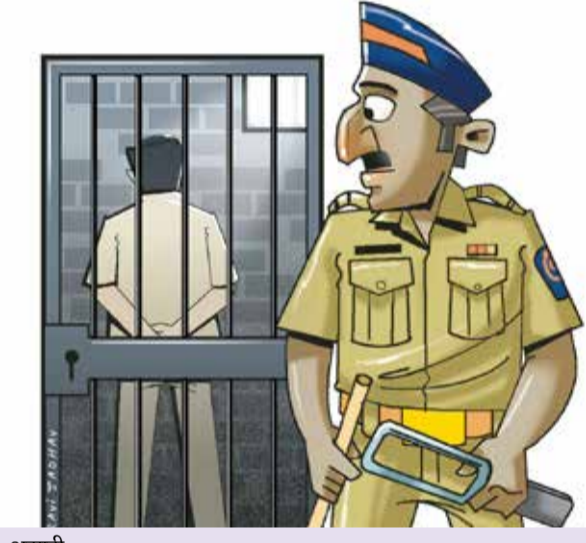
असावी. एवढेच नाही तर घनादेशावर नीट सही करावी, जेणेकरून तो बाऊन्स

तुम्ही तुमच्या चेकवर तपशील अचूक भरला पाहिजे. उदाहरणार्थ, आकृत्यांमध्ये रक्कम लिहिल्यानंतर, ती ( - ) चिन्हाने बंद करा आणि संपूर्ण रक्कम शब्दात लिहिल्यानंतर, फक्त लिहा. यामुळे तुमचा चेक फसवणूक होण्याची शक्यता कमी होते. चेकचा प्रकार स्पष्टपणे नमूद करा. जसे की तो खातेदार घनादेश असो की बेअरर चेक. त्यावर कोणती तारीख लिहिली आहे? ही माहिती चेकवर स्पष्ट