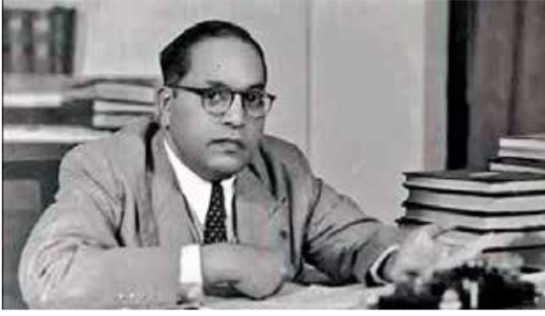
विद्यार्थी, पालक, शिक्षक आणि शासन यांना प्रामाणिक राहून कार्य करणे आवश्यक आहे. परंतु वास्तवात भारतीय शिक्षणव्यवस्था या उद्दिष्टापासून अद्याप बरीच दूर आहे, हीच खरी चिंतेची बाब आहे.

‘भारतीय विद्यार्थी दिन’ साजरा करण्यामागे एक ऐतिहासिक कारण आहे. ७ नोव्हेंबर १९०० रोजी भारतरत्न डॉ. बाबासाहेब आंबेडकर (तेव्हा भिवा या नावाने) साताऱ्यातील प्रतापसिंग हायस्कूल, राजवाडा चौक येथे दाखल झाले. या शाळेच्या रजिस्टरमध्ये क्रमांक १११४ समोर आजही त्यांची स्वाक्षरी जतन केलेली आहे. ही घटना भारतीय शिक्षण व सामाजिक क्रांतीच्या इतिहासातील एक अमूल्य ठेवा आहे. शाळेत शिक्षण व क्रीडा विभागाने या ऐतिहासिक घटनेच्या स्मरणार्थ ७ नोव्हेंबर हा दिवस ‘विद्यार्थी दिन’ म्हणून साजरा करण्याचा निर्णय घेतला आहे. या दिवशी राज्यातील सर्व शाळा आणि महाविद्यालयांमध्ये बाबासाहेबांच्या जीवनकार्यावर आधारित निबंध, वक्तृत्व, काव्यवाचन यांसारख्या उपक्रमांचे आयोजन केले जाते. ७ नोव्हेंबरचा हा दिवस केवळ डॉ. आंबेडकरांच्या शाळा प्रवेशाचा स्मृतीदिन नसून, तो भारतीय इतिहासातील विचारप्रबोधन, समानता, बंधुता आणि शैक्षणिक क्रांतीची सुरुवात दर्शवतो. बाबासाहेबांनी शिक्षणाद्वारे स्वतःचे जीवन उन्नत केले आणि कोट्यवधी वंचितांना प्रकाशाचा मार्ग दाखविला. त्यांच्या संविधानामुळे भारतात स्वातंत्र्य, समता, बंधुता आणि न्याय ही मूल्ये दृढपणे रुजली. म्हणूनच हा दिवस ‘विद्यार्थी दिन’ म्हणून साजरा केला जाणे ही भारतीय समाजासाठी अभिमानाची बाब आहे. हा दिवस विद्यार्थ्यांच्या समस्या व प्रश्न समाजासमोर मांडण्याचा आणि त्यावर उपाय शोधण्याचा एक महत्त्वपूर्ण दिवस म्हणून साजरा होत आहे. विद्यार्थी म्हणजे केवळ पुस्तकी ज्ञान नव्हे; तर बौद्धिक, मानसिक, शारीरिक, भावनिक, आत्मिक, सामाजिक, राजकीय व आर्थिक अशा सर्व अंगांचा विकास. विद्यार्थ्यांचा सर्वांगीण विकास हेच शिक्षणाचे मूळ उद्दिष्ट आहे. या उद्दिष्टाशी