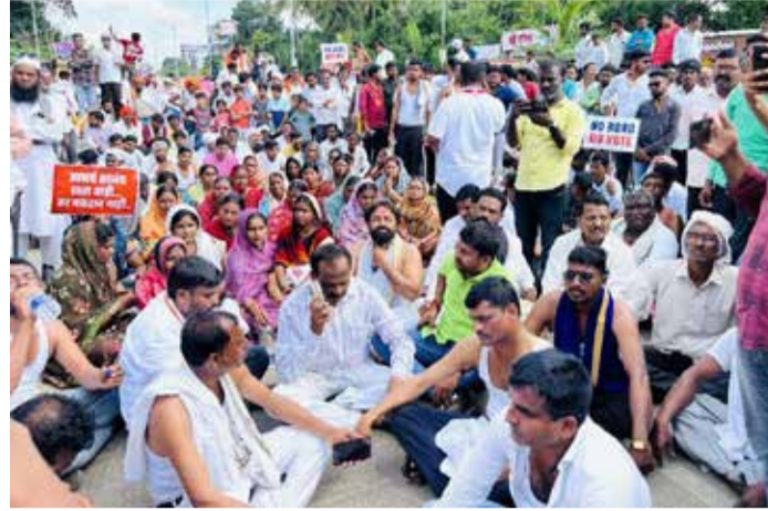
या रस्त्याचे तीन तेरा वाजलेले दिसत असून रस्त्यावर चक्क कंबर एवढे एक हजार पेक्षा

बीड | अमोल जाधव गेल्या कितके वर्षापासून बीड नाळवंडी रस्त्याची मागणी वारंवार चालू आहे मात्र वीस वर्षापासून चालू असलेल्या या मागणीला अजून काही न्याय मिळाला नाही. गल्लीपासून ते दिल्लीपर्यंत पोते भरून निवेदने या बीड नाळवंडी रस्त्यासाठी देण्यात आली. मात्र अद्याप हा रस्ता कुणी करून द्यायला तयार नाही. या रस्त्यासाठी अनेक आंदोलने, मोर्चे निघाले मात्र सगळ्या प्रतिनिधींनी या कडे पाठ फिरवलेली दिसत आहे. बीड नाळवंडी रस्ता नीट नसल्याने नाळवंडी सह चिंचोली, दहिकळ, अन्य गावाचा संपर्क तुटलेला आहे. या वर्षी झालेल्या पावसाच्या अतिवृष्टीमुळे पूर्ण रस्ता च वाहून गेला. आणि या रस्त्या लगत आलेल्या खडी क्रेशर मुळे