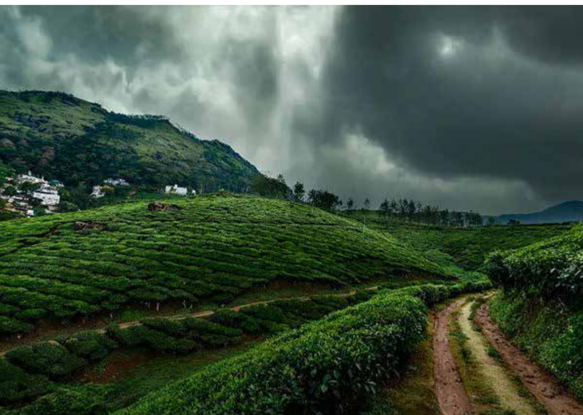
वाढण्याची शक्यता आहे .

हवामान विभागाने दिलेल्या माहितीनुसार, ऑक्टोबर महिन्यात महाराष्ट्रातही सरासरीपेक्षा अधिक पाऊस पडण्याची शक्यता आहे . विदर्भ, मध्य महाराष्ट्र आणि कोकण या भागांमध्ये सरासरीपेक्षा जास्त पाऊस होण्याची शक्यता अधिक आहे . राज्यात सप्टेंबर महिन्यात झालेल्या परतीच्या आणि अतिवृष्टीच्या पावसामुळे शेती पिकांचे मोठे नुकसान झाले आहे . ऑक्टोबरमध्येही पावसाचा जोर कायम राहिल्यास शेतकऱ्यांची चिंता