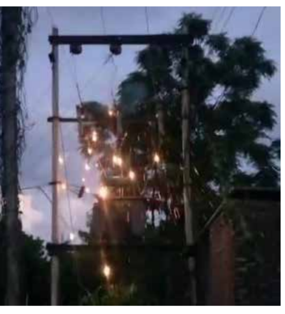
महावितरण चा सहभाग आहे असे गृहीत धरून भविष्यात मोठ्या प्रमाणात आंदोलन केले जाईल असेही सामाजिक कार्यकर्त्यांकडून सांगितले आहे .