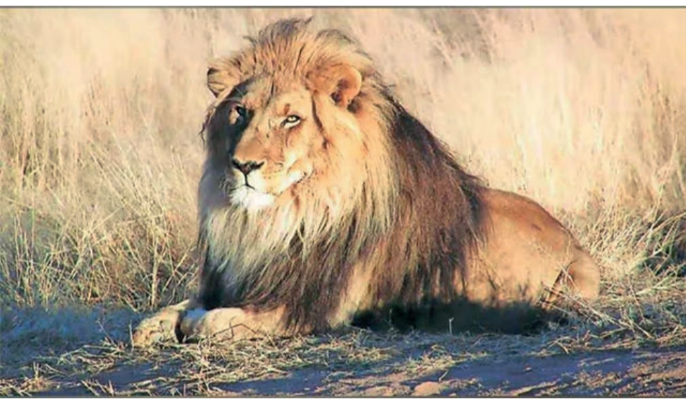
संजय गांधी राष्ट्रीय उद्यानात दाखल झाली होती. मात्र, त्या जोडीचे मिलन होत नव्हते. मागील वर्षी उद्यानातील पथकाने मानसी आणि मानस यांच्या मिलनासाठी प्रयत्न सुरू केले होते. संजय गांधी राष्ट्रीय उद्यानात २००९ मध्ये रवींद्र आणि शोभा ही सिंहाची जोडी आणण्यात आली होती. शोभा सिंहाणीने २०११ मध्ये दोन माद्या आणि एक नर छाव्याला जन्म दिला. 'लिटिल शोभा', जेव्हा आणि गोपा हे या जोडीचे छावे. सिंहाचे हे कुटुंब गेली अनेक वर्षे पर्यटकांसाठी आकर्षण ठरले होते. मात्र, काही वर्षांपूर्वी शोभाचा मृत्यू झाला. त्यानंतर २०२१ मध्ये गोपाचा मृत्यू झाला. तर २०२२ मध्ये रवींद्र आणि जेव्हा यांचाही मृत्यू झाला. अनेक वर्षे राष्ट्रीय उद्यानातील अविभाज्य भाग असलेले सिंहांचे कुटुंब निवर्तल्यानंतर २०२२ मध्ये गुजरातमधून 'मानस' आणि 'मानसी' या सिंहांच्या जोडीला संजय गांधी राष्ट्रीय उद्यानात आणण्यात आले होते. मागील वर्षी उद्यानातील पथकाने मानसी आणि मानस यांच्या मिलनासाठी प्रयत्न सुरू केले होते. आता संजय गांधी राष्ट्रीय उद्यानातील सिंहाची एकूण संख्या ५ झाली आहे. त्यातील मानस आणि मानसीचा छावा वगळता बाकी चार सिंह सफारीमध्ये पाहता येतील.

मुंबई : संजय गांधी राष्ट्रीय उद्यानात सिंह सफारी आणि व्याघ्र सफारीला भेट देणाऱ्या पर्यटकांची संख्या सर्वाधिक आहे. सिंह सफारीत गुजरातहून आणलेली 'मानस' आणि 'मानसी' ही सिंहाची जोडी लोकप्रिय ठरली आहे. दरम्यान, या सफारीत आता सिंहाची नवीन जोडी दाखल झाली आहे. त्यामुळे राष्ट्रीय उद्यानातील सिंह सफारीला नव्याने चालना मिळणार आहे. बोरिवली येथील संजय गांधी राष्ट्रीय उद्यानात गुजरात येथील सक्करबाग प्राणिसंग्रहालयातून आणलेली सिंहाची जोडी आता सिंह सफारीत दाखल झाली आहे. गुजरात येथील सक्करबाग प्राणिसंग्रहालयातून २६ जानेवारी रोजी सिंहाची ही जोडी आणण्यात आली होती. ही सिंहाची जोडी तीन वर्षांची आहे. काही दिवस या जोडीला निरीक्षण कक्षात ठेवण्यात आले होते. आता ही जोडी सिंह सफारीत दाखल झाली आहे. त्यामुळे यापुढे पर्यटकांना सिंहाची नवी जोडीही पाहता येणार आहे. काही दिवसांपूर्वी राष्ट्रीय उद्यानातील मानसीने एका छाव्याला जन्म दिला. 'मानस' आणि 'मानसी' सिंहाची ही जोडी २०२२ मध्ये