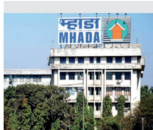
भाडेकरू/ रहिवाशांना लागू आहे. सद्यस्थितीला नमूद ११ अर्जदार हे धोकादायक व जीर्ण संक्रमण गाळ्यांमध्ये वास्तव्यास नाहीत. त्यामुळे सदर प्रकरण हे धोरणात्मक असल्याने त्याला वरिष्ठांची मान्यता आवश्यक होती. पूर्वी संक्रमण शिबिरांमध्ये घुसखोराविरुद्ध मोहिमेअंतर्गत म्हाडामार्फत कार्यवाही

पुनर्विकाससाठी सदर चाळीतील गाळ्यांच्या बदल्यात इतर संक्रमण शिबिरात पर्यायी स्थलांतर देण्याच्या मागणीसाठी ११ अर्जदारांनी अर्ज केला. या अगोदर जुलै २०२०, मार्च २०२१, जून २०२१ व ऑक्टोबर २०२१ मध्ये कन्न्मवार नगर विक्रोळी संक्रमण शिबिरातील जुन्या जीर्ण व धोकादायक चाळीमधील वास्तव्यास असणाऱ्या रहिवाशांना संभाव्य जीवित वित्त आणि टाळण्यासाठी मानवतेच्या दृष्टिकोनातून पुनर्विकास कार्यक्रमांतर्गत नव्याने बांधण्यात आलेल्या नवीन पुनर्रचित इमारतीत उपाध्यक्ष तथा मुख्य कार्यकारी अधिकारी प्राधिकरणा यांच्या मान्यतेने पात्र/अपात्रतेच्या अधीन राहून तापुरते स्थलांतरण देण्यात आले आहे. सदर परिपत्रक केवळ सदरस्थितीत वास्तव्यास असणाऱ्या