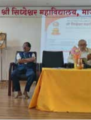
मान्यवरांच्या हस्ते प्रारंभी पुण्यश्लोक अहिल्यादेवी होळकर व स्वामी रामानंद तीर्थ यांच्या प्रतिमेचे पूजन करण्यात आले. 'स्वातंत्र्य उत्तर काळात मराठवाडा प्रदेशाच्या विकासात स्वामी रामानंद तीर्थ यांचे योगदान' या विषयी सविस्तर मांडणी करताना ते म्हणाले की, मराठवाडा मुक्ती