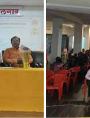
संग्रामचा लढा हा स्वातंत्र्याचा अखेरचा लढा होता या लढ्यामध्ये शिक्षकांचा सक्रीय सहभाग होता त्यामुळे मराठवाड्याच्या शैक्षणिक विकासात स्वामी रामानंद तीर्थ यांनी अंबाजोगाई, नांदेड या भागामध्ये भरीव योगदान देत लोकांचा शैक्षणिक विकास साधत त्यांचे राष्ट्रीयत्व जागे केले.